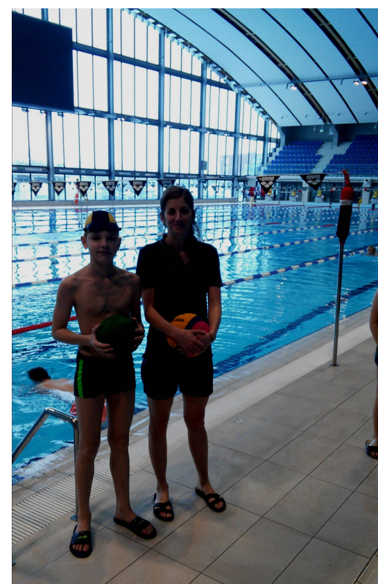
Wywiad przygotował i przeprowadził Bartosz Kański z kl. 6a, zawodnik lubelskiej grupy AZS Waterpolo

Mając w naszym mieście znakomite warunki do treningów, naszym celem jest zbudowanie zespołu, który z powodzeniem będzie występował w rozgrywkach ligowych Polskiego Związku Pływackiego, ale przede wszystkim chcemy popularyzować piłkę wodną jako dyscyplinę sportu i zdrowego stylu życia.